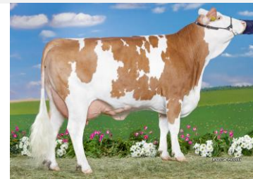
Ćerka Dörte DE 0950105411

Boja tela: 46% crvena, 33% tamnožuta, 17% tamnocrvena